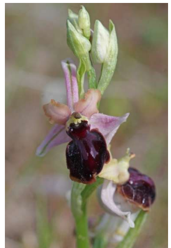
Ophrys passionis – Erdeven et Plouhinec