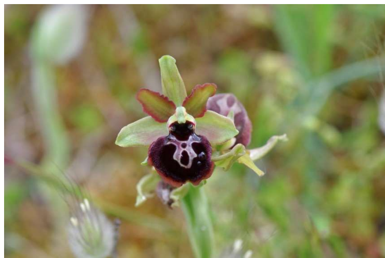
Ophrys passionis – Erdeven et Plouhinec