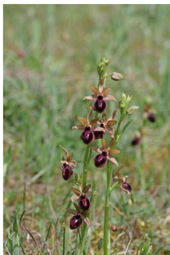
Ophrys passionis Erdeven - [4]

Nous prenons le repas à la même crêperie qu'hier (elle est accueillante et pratique).