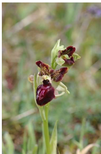
Lusus (« Mickey ») d' Ophrys passionis – Erdeven et Plouhinec