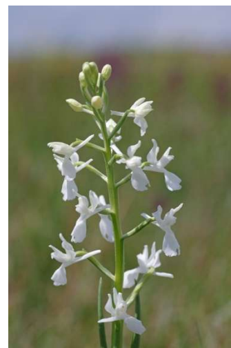
Anacamptis laxiflora Erdeven - [4]