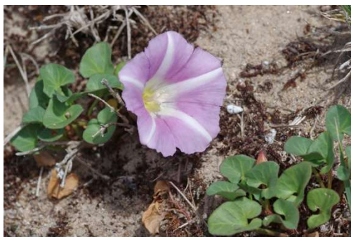
Convolvulus soldanella Erdeven - [4]

Nous prenons le repas dans une crêperie voisine.