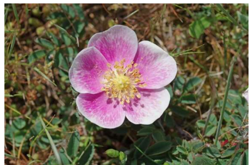
Rosa pimpinella Erdeven - [1]