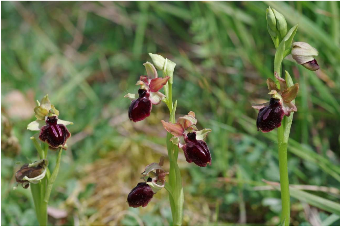
Ophrys passionis – Erdeven

Début décembre 2025, Fabienne avait montré des photos d' Ophrys passionis prises à Erdeven, dans le Morbihan. La variété des formes et surtout des couleurs avait suscité beaucoup d'intérêt. Puis l'idée d'une sortie en groupe pour voir ces plantes a germé, et s'est concrétisée : c'était pendant le week-end du 1 er mai, sous la conduite d'Hervé Poussier, qui connaît bien les stations (il les visite presque tous les ans). Six mobile-homes avaient été réservés au camping de Kerhillio.