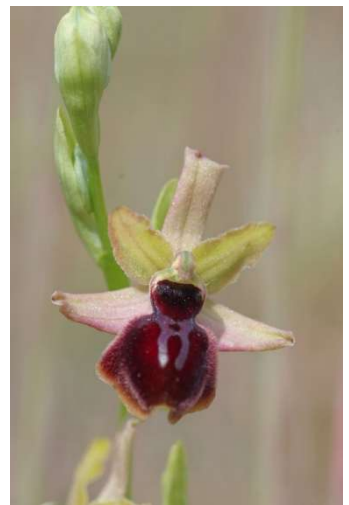
Ophrys passionis – Erdeven et Plouhinec