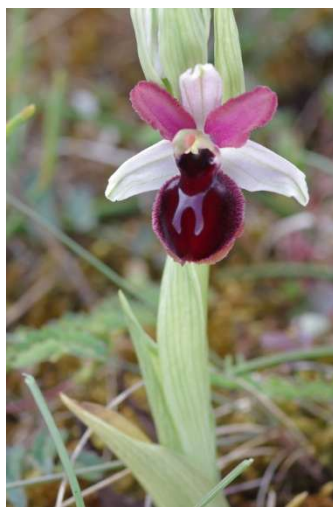
Ophrys passionis – Erdeven et Plouhinec