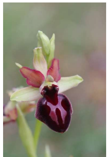
Ophrys passionis – Erdeven et Plouhinec