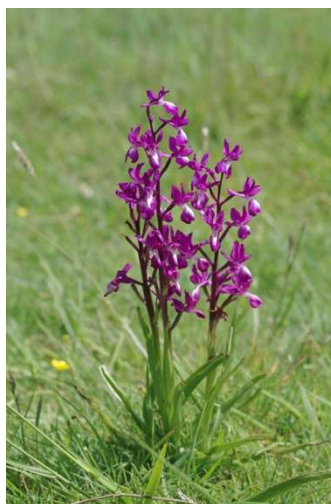
Anacamptis laxiflora Erdeven - [4]