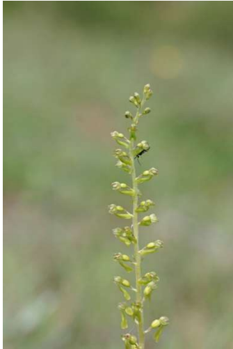
Neottia ovata Le Magouër - Plouhinec - [3]