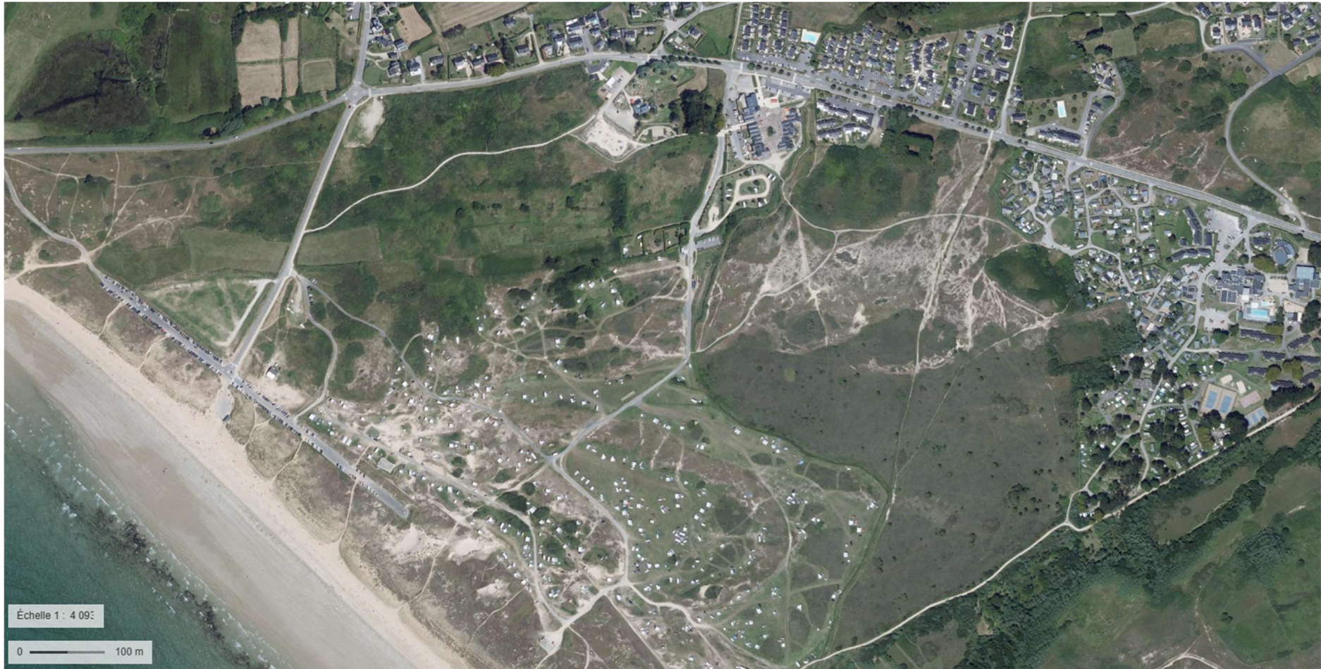
La même zone que ci-dessus, sur une vue aérienne prise le 19 juillet 2024 par l'IGN. Les orchidées ont bien repris possession des lieux.