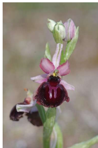
Ophrys passionis – Erdeven et Plouhinec