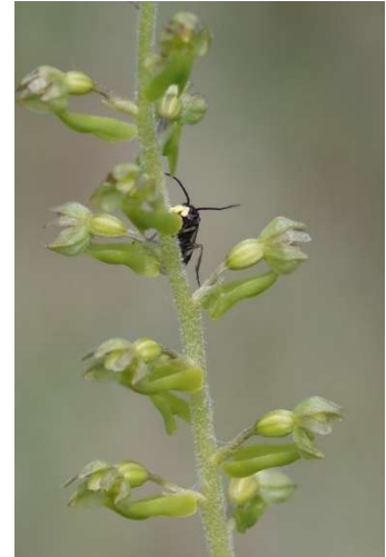
Pollinisateur sur Neottia ovata Le Magouër - Plouhinec - [3]