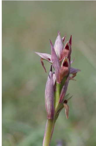
Serapias parviflora Le Magouër - Plouhinec - [3]