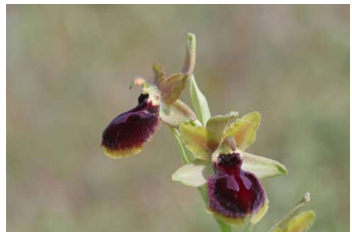
Ophrys passionis – Erdeven et Plouhinec